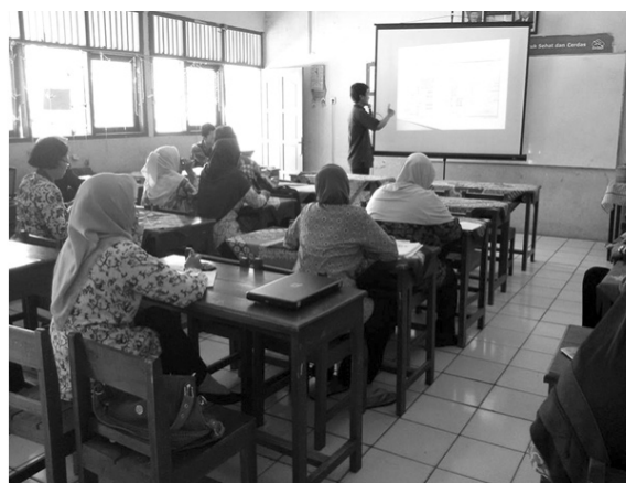
Gambar 3: Praktik Diklat di Sekolah untuk Para Guru

Ragam hal yang menjadi kendala dalam pelaksanaan diklat sebagian besar adalah: tim pengembang TP tidak diberi akses yang leluasa dalam mengambil data untuk kebutuhan analisis kebutuhan diklat, baik melalui angket, wawancara, maupun dokumentasi. Hal tersebut terjadi karena beberapa hal. Terutama (1) jalinan komunikasi yang belum lancar antara tim pengembang TP dengan pihak sekolah; (2) hambatan psikologis dari pihak sekolah yang seakan-akan enggan untuk diambil datanya dan diketahui oleh tim pengembang TP untuk dianalisis; (3) sikap sebagian oknum guru di sekolah yang menganggap remeh aktivitas pengambilan data dan analisis untuk kebutuhan diklat.