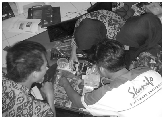
Gambar 1: Praktik Pengembangan Media Pembelajaran

Berdasarkan pada hasil FGD yang dilakukan, pengembangan multimedia tidak semuanya berjalan dengan mulus. Beberapa sekolah yang menjadi tempat praktik, tim pengembang teknologi pendidikan relatif sulit untuk melakukan aktivitas pengembangan multimedia pembelajaran interaktif. Di SDN Pudukpayung 1 misalnya, gurunya tidak familiar dengan perangkat pembelajaran berbasis Teknologi Informasi dan Komunikasi (TIK), hingga ketika para guru ditawarkan untuk dibantu dalam mengembangkan MPI, tawaran tersebut ditolak.